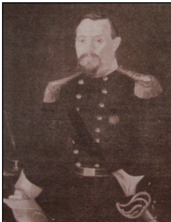
Retrato de Natale Paggi de 1860. (Imagen extraída de Framenti di Storia Lavagnese , obra escrita por DANERI Angelo y MOSTO, Sergio)