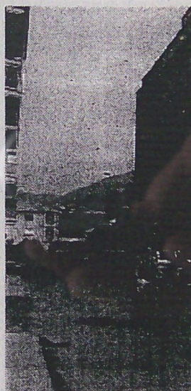
Via Paggi a Lavagna